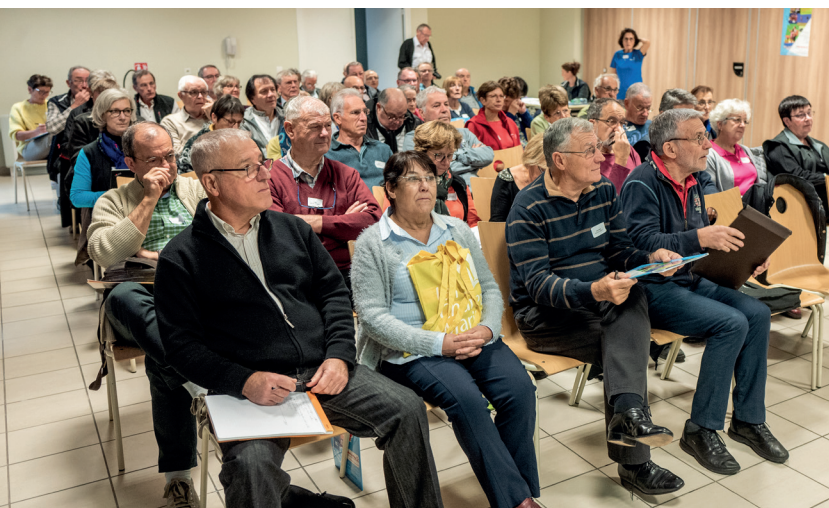
Le public attentif sur la thématique de la formation