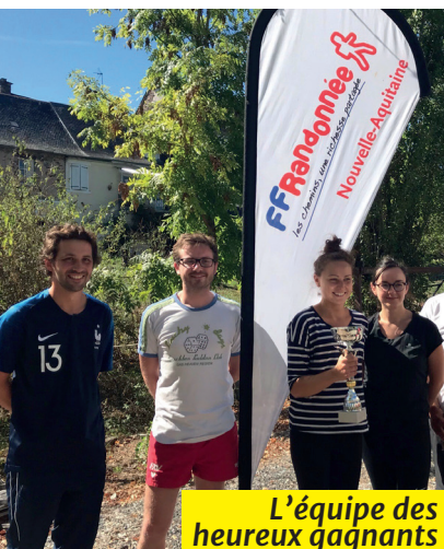
L'équipe des heureux gagnants

Tous les participants, séduits par le concept ont promis de revenir dès qu'une nouvelle journée serait organisée.