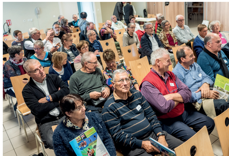
Les représentants des comités départementaux

Un autre sujet a suscité des débats intéressants : la Formation sur la région Nouvelle-Aquitaine.