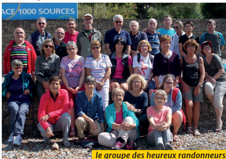
le groupe des heureux randonneurs

Le soleil fut au rendez-vous et chacun est reparti, enchanté par cette découverte d'une région un peu méconnue et magnifique.