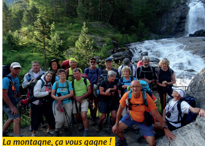
La montagne, ça vous gagne !