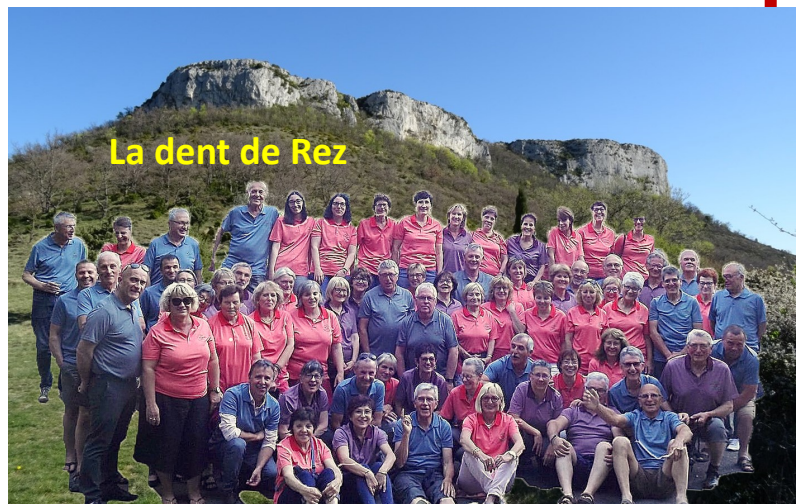
La dent de Rez

Petits déjeuner et pique-nique copieux. Repas en terrasse tellement il faisait beau.