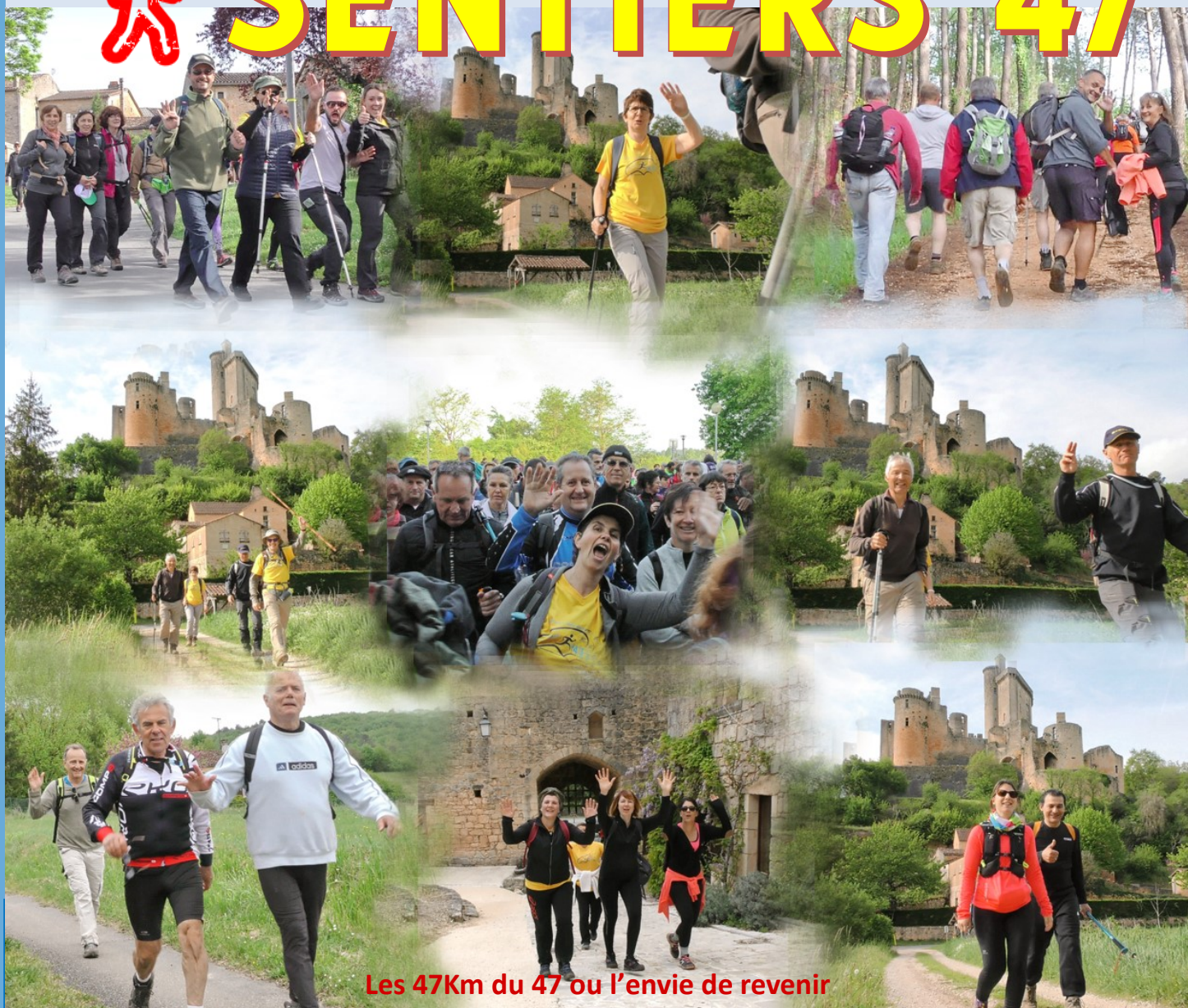
Les 47km du 47 ou l'envie de revenir

L'été est enfin arrivé ! La saison estivale, pause bienfaitrice, est propice à découvrir les nombreuses richesses et beautés de notre territoire en empruntant les chemins de randonnée. Rien de tel pour se déconnecter du quotidien, que de se laisser guider en pleine nature par nos balisages mais aussi au travers de notre patrimoine historique si riche en Lot-et-Garonne. Partageons notre passion en famille, entre amis ou tout simplement seul. La saison sportive qui s'achève a vu le succès des 47 km du 47 avec 1208 participants, ravis de marcher avec le beau temps ! Merci aux nombreux bénévoles et à nos partenaires. N'oubliez pas de noter sur vos agendas les deux manifestations organisées par le Comité : Le 6 octobre la « Marguerite en Vallée du Lot » à Laparade avec des circuits accessibles à tous. Le 17 novembre, la journée départementale de la marche nordique « Nordic Tonic » à Monclar d'Agenais. Bel été à tous sur nos chemins