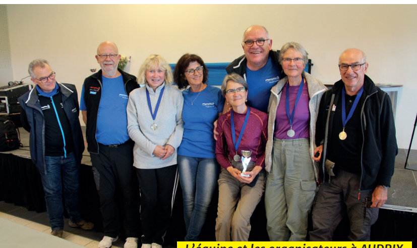
L'équipe et les organisateurs à AUDRIX

Un Rando Challenge® Départemental a eu lieu le 18 mars 2019 à Tabanac en Gironde. Equipe première : CEUX du Bassin (Arcachon)