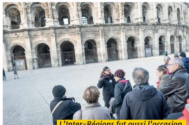
L'Inter-Régions fut aussi l'occasion de découvrir le centre de Nîmes et ses incontournables arènes.